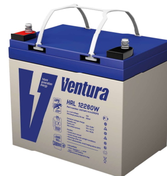
Габаритные размеры, мм

Примечание: приведены средние значения, полученные в течение трех циклов заряда/разряда Производитель оставляет за собой право вносить изменения в связи с проводящимися мероприятиями по оптимизации типов